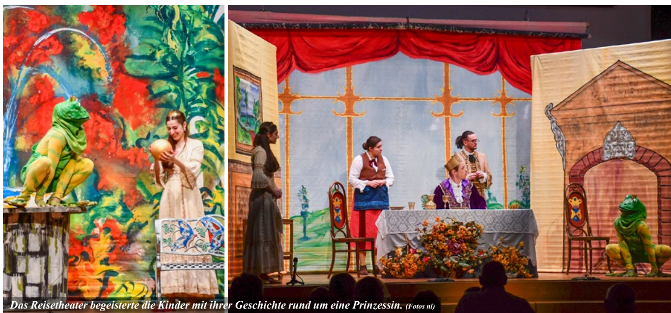
Das Reisetheater begeisterte die Kinder mit ihrer Geschichte rund um eine Prinzessin.